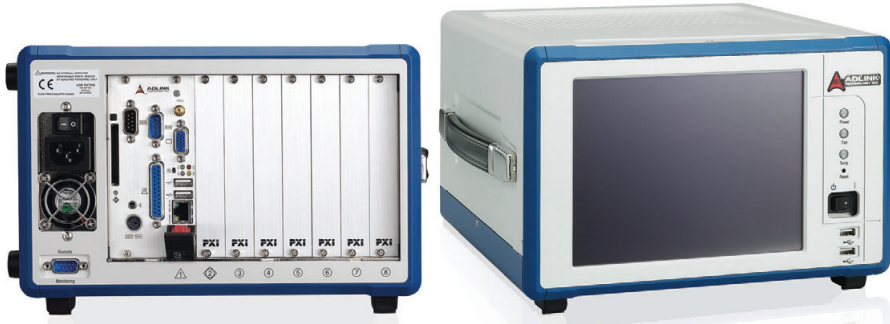
Рис. 10. Шасси PXIS-2508 (слева) и PXIS-2558T (справа)

2508 и PXIS-2558T (с 8,4" ЖК-дисплеем) оборудованы эффективной системой охлаждения с контролем температуры источника питающего напряжения и скорости воздушного потока. Наличие такой системы охлаждения делает возможной работу устройства в широком температурном диапазоне от -20 до +70°C. Прочный и лёгкий корпус (масса 6 кг при габаритах 280×177×303 мм) выполнен из алюминиевого сплава, имеет ручку для переноски, комплектуется блоком питания 350 Вт (рис. 10). Отличительная особенность данных шасси – низкий уровень акустического шума (не более 47 дБ). Удалённое управление, в том числе «Вкл./выкл.», реализуется через встроенный порт RS-232.