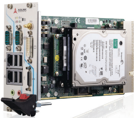
Рис. 9. Контроллер PXI-3950

Разговор о конкретных решениях и системах, которые можно построить на базе стандартов, представленных в первой части статьи, продолжим на примерах оборудования компании ADLINK Technology Inc. Эта компания была основана в 1995 году на Тайване. Одним из ведущих направлений её деятельности является разработка и производство компьютерных платформ различных форматов, а также многофункциональных высокопроизводительных устройств сбора данных и программного обеспечения к ним. Компания ADLINK является членом и спонсором альянса PXI.