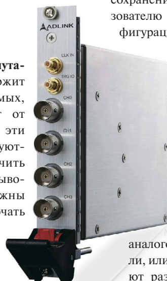
Рис. 14. Модуль АЦП (дигитайзер) PXI-9816/9826/9846

PXI-9816/9826/9846 – аналого-цифровые преобразователи, или дигитайзеры (рис. 14). Имеют разрешение 16 бит, 4 канала непрерывного опроса с частотами 10/20/40 млн опросов в секунду (для PXI-9816/9826/9846 соответ-