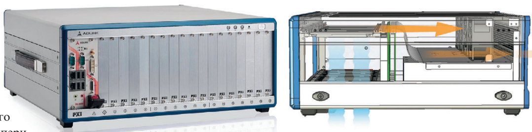
Рис. 12. Внешний вид шасси PXIS-2719 и схема охлаждения модулей внутри него

Модули серии PXI-2000 разработаны для решения задач ввода аналоговых и цифровых данных одновременно по 4 каналам и характеризуются высокой разрешающей способностью от 14 до