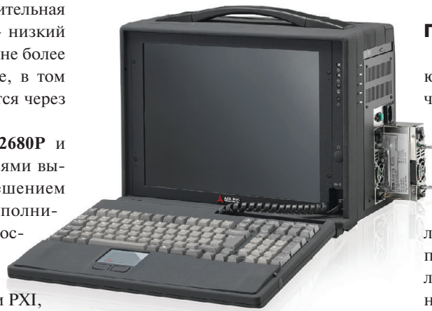
Рис. 11. Шасси PXIS-2680P

но на расширенный температурный диапазон (-20...+70°C) и обеспечивает хорошее охлаждение модулей благодаря эффективной автоматической системе вентиляции слотов. В PXIS-2719 реализована система динамического контроля состояния шасси и заложена возможность удалённого управления по встроенному интерфейсу RS-232. В шасси установлен промышленный блок питания мощностью 700 Вт. Для контроля состояния служит светодиодная индикация на передней панели.