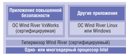
Рис. 4. Виртуализация в приложениях с повышенными требованиями к безопасности