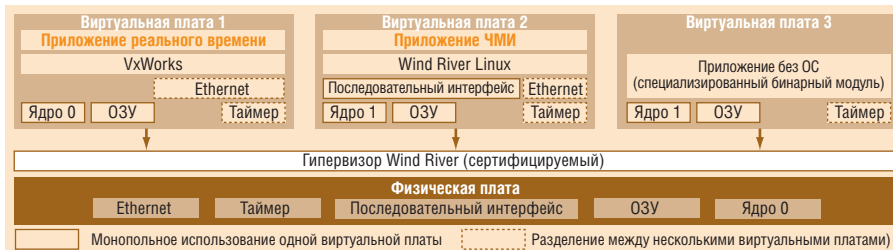
Рис. 3. Разбиение системы на несколько виртуальных плат

Разделение ресурсов и защита виртуальных плат предотвращают влияние возможных сбоев в работе одной платы на работу других. Если возникает проблема в менее критичной задаче графического интерфейса, она не нарушит работу другой виртуальной платы, отвеча-