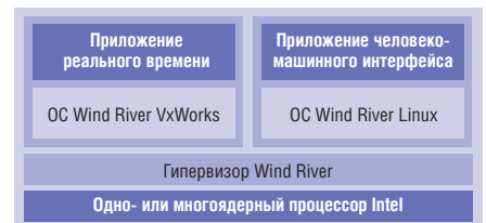
Рис. 1. Виртуализация вычислений

По мере роста сложности регулирующие органы выпускают всё больше формальных методов и процессов сертифици-