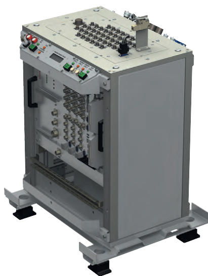
Рис. 4. Вид сервера со снятыми передней крышкой и верхним кожухом

Корпус сервера выполнен из листового гнутого алюминиевого сплава. Спереди и сзади имеются съёмные крышки с ручками для удобства снятия крышек при осуществлении доступа к оборудованию внутри корпуса. Конструкция корпуса сервера обеспечивает его прохождение в минимально разобранном виде в корабельный люк 600×600 мм с радиусами закругления 100 мм и в ло-