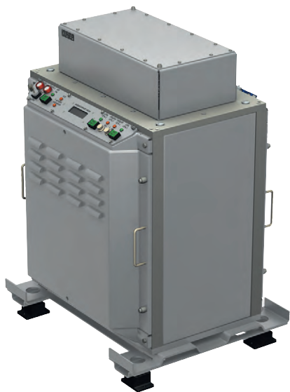
Рис. 3. Внешний вид конструкции сервера

Конструктивно сервер представляет собой тумбу с размещёнными в ней вычислительными средствами. Тумба установлена на основании, которое снабжено четырьмя амортизаторами АКСС-25.