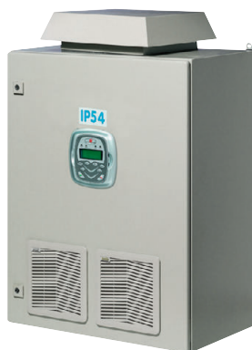
Рис. 3. Многоцелевой преобразователь частоты SINUS PENTA исполнения BOB

В стандартную комплектацию входят два встроенных ПИД-регулятора с возможностью двухзонного регулирования, а также встроенный цифровой потенциометр и многофункциональный тестер. Имеется обратная связь от тахометра или цифрового датчика скорости. Реализовано автоматическое торможение постоянным током. Максимальный момент – 200% от номинального.