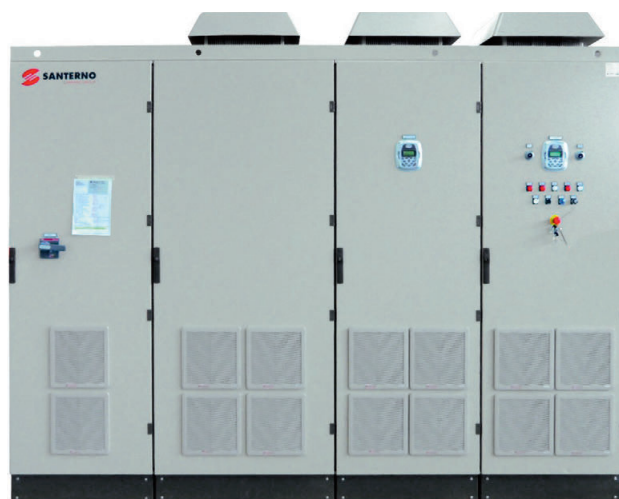
Рис. 4. Многоцелевой преобразователь частоты SINUS PENTA исполнения CABINET

У частотного преобразователя есть 8 программируемых дискретных входов, 3 программируемых аналоговых входа и 3 выхода, 2 программируемых релейных выхода с переключающим контактом, 1 выход с открытым коллектором, 1 переключающий выход. Имеется порт последовательной связи RS-485 с протоколом Modbus RTU.