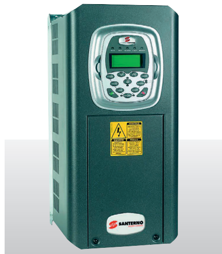
Рис. 1. Многоцелевой преобразователь частоты SINUS PENTA