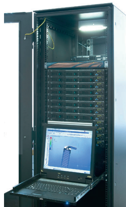
Рис. 1. Шкаф мультипроцессорной системы

Отличительными особенностями разработанной системы являются рекордные значения достигнутой плотности вычислений (в терминах FLOPS/Wt) и использование высокоскоростной сети обмена данными между вычислительными узлами с низкими уровнями задержки сигнала. В качестве вычислительных узлов были использованы одноюнитовые серверы компании Intel с двумя двухъядерными процессорами Intel Xeon серии 5100, работающими при пониженном напряжении питания и, соответственно, с пониженными значениями рассеиваемой тепловой мощности. Это позволило создать компактное решение, где все компоненты системы: вычислительные узлы, коммутаторы Gigabit Ethernet, коммутаторы Infiniband и система бесперебойного питания — размещаются в одной стандартной закрытой 19-дюймовой стойке, в качестве которой был использован новый шкаф для электронного оборудования VARISTAR производства компании Schroff. Шкаф имеет пылевлагозащитное исполнение (степень защиты IP54), что позволяет использовать мультипроцессорную систему не просто вне специально подготовленных кондиционированных помещений, а непосредственно в производственных помеще-