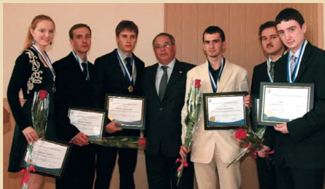
Награждение победителей ESPC-2009