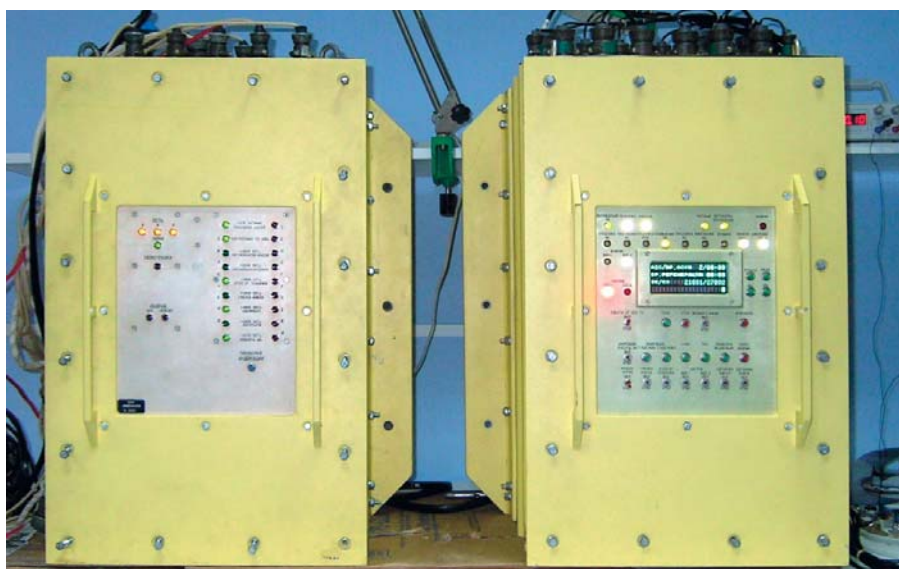
Рис. 1. Оборудование системы автоматического управления компрессорной станции: слева – шкаф силовой (ШС), справа – прибор управления электрокомпрессором и блоком осушки (ПУ ЭКБО)

Далее в статье приводится краткая характеристика данных приборов.