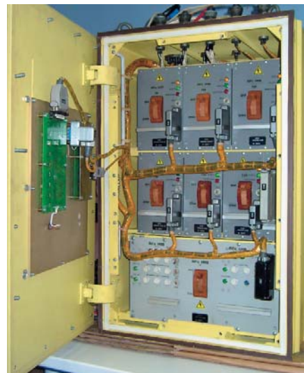
Рис. 3. Шкаф силовой