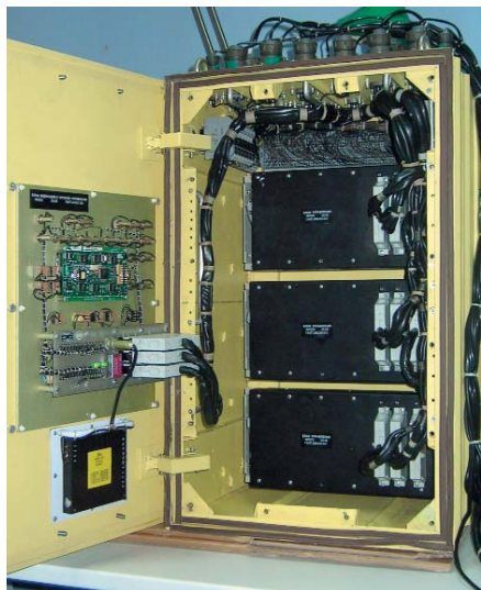
Рис. 2. Прибор управления электрокомпрессором и блоком осушки

цией посредством лицевой панели ПУ ЭКБО, так и удалённое управление от центрального бортового компьютера.