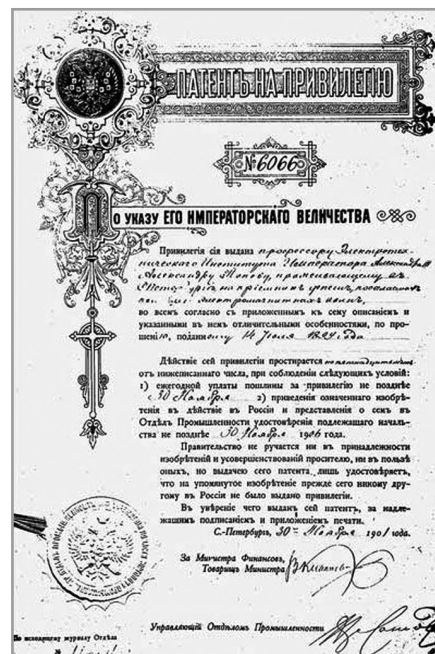
Рис. 1. Российский патент А.С. Попова на телефонный приёмник депеш (1900 г.)

Особый интерес вызывает американский патент А.С. Попова, на который нигде и никогда не было ссылок. По номеру патента удалось отыскать его описание. Оригинальное название патента "SELF-DECOHERING COHERER SYSTEM". При этом декодирующий